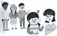
외모에 대한 차별