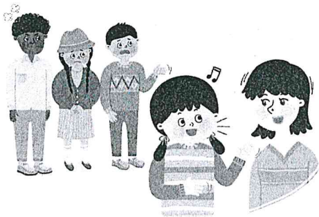
외모에 대한 차별